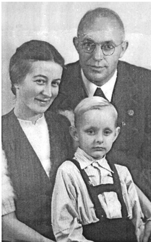
Abb. 4: Hitzacker, 23. Oktober 1943, das erste Familienphoto mit der Beschriftung: „Unserer lieben Oma eine kleine Freude von Mutti, Vati und Wölfchen“

und daß der Junge sehr an ihr hänge, seine Mutter „gehe ihm über alles“.