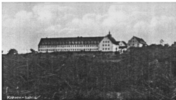
Abb. 1: Kinderheim Kohren-Sahlis/Sachsen; Ansicht auf einer Postkarte, die Wolfgang Schulze von einer ehemaligen Kinderschwester des Heimes erhielt.

Am 26.9.1942 wird Wolfgang bei den Pflegeeltern Knupe abgeholt und in das Kinderheim „Sonnenwiese“ in Kohren-Sahlis/Sachsen gebracht. Das Heim „Sonnenwiese“ wurde offiziell im November 1942 eingeweiht; offensichtlich hatte man Wolfgang dort bereits vor der offiziellen Einweihung aufgenommen. Das Kinderheim stand unter ärztlicher Leitung und besaß ca. 170 Plätze. Säuglinge, deren Mütter schon aus den Entbindungsheimen entlassen worden waren, wurden hierher verlegt, anscheinend auch ältere Kinder; später kamen noch ausländische Kinder hinzu. 4 Wolfgang war inzwischen fünfeinhalb Jahre alt, und man machte sich von seiten des „Lebensborn“ Gedanken darüber, was in Zukunft mit ihm ge-